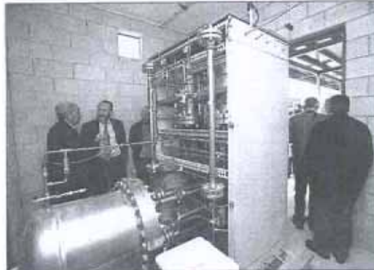
En el 'corazón' de este nuevo sistema de energía limpia aún por desarrollar.

Pero precisamente ese carácter global de la crisis impide ser optimistas respecto al resultado de la mesa. Y el propio regidor de la capital lo dejó muy claro al afirmar que «no hay fórmulas mágicas ni oasis en el desierto», que la mesa local no será la piedra filosofal ni