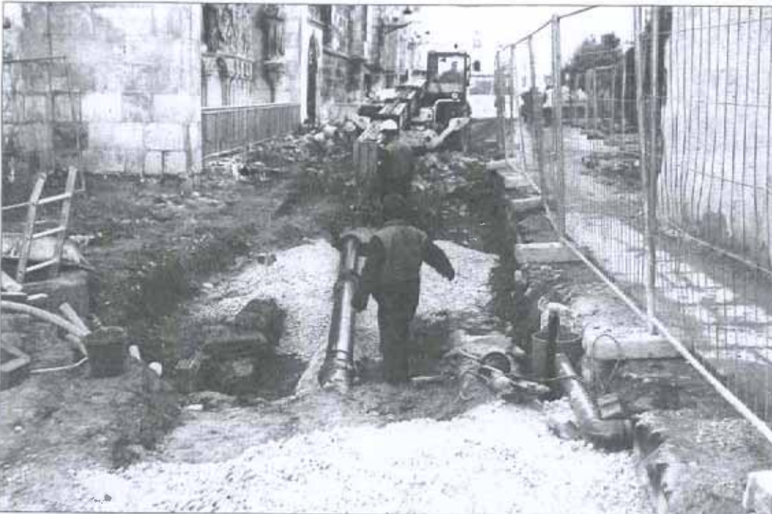
La mesa de análisis de la crisis en la ciudad de Burgos prestará especial atención al sector de la construcción y al de la industria.